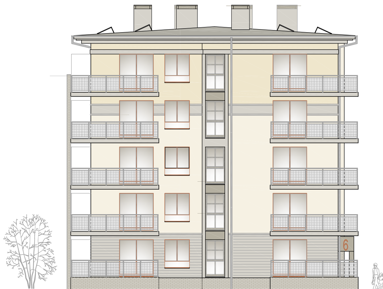
ELEWACJA POŁUDNIOWO - WSCHODNIA